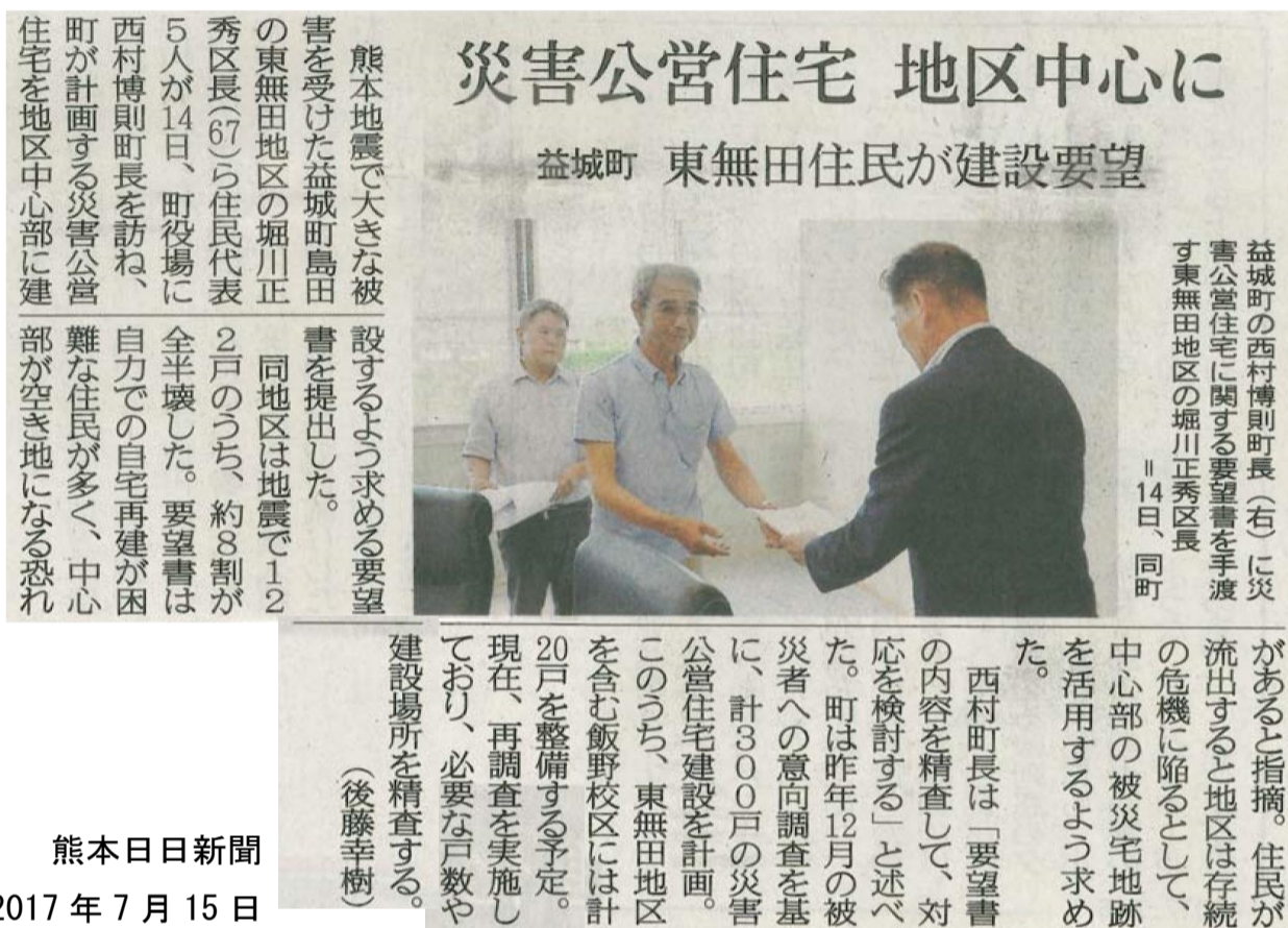
熊本日日新聞 2017年7月15日