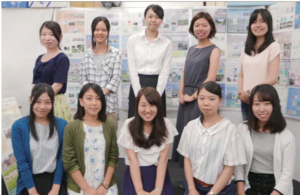
環境デザイン研究室 技術士第一次試験合格者