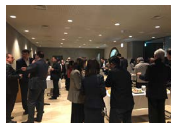
レセプション会場にて両国の 交流を深める参加者の皆さん