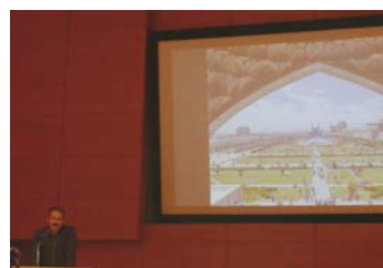
イランの古都「エスファハーン」 について講演している様子